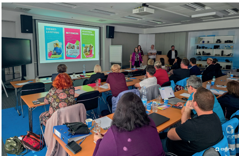
Foto: Vorstellung von steyrland und BOCK bei der LeiterInnendienstbesprechung im Oktober

37 Besuche bei InteressentInnen und Mitgliedern wurde getätigt