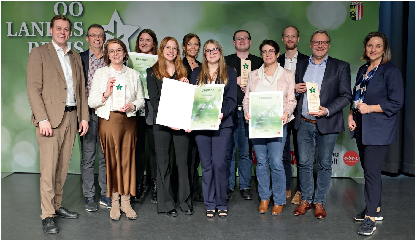
Foto: Aus 201 Einreichungen wurden drei Projekte aus unserem Netzwerk prämiert.

steyrland-Mitgliedsschule Gymnasium Werndlpark konnte mit ihrem Projekt „Am Weg zur Mehrwegschule“ überzeugen & steyrland-Mitgliedsbetrieb my-PV wurde für ihr solarelektrisches Firmengebäude ausgezeichnet. HERZLICHEN GLÜCKWUNSCH!