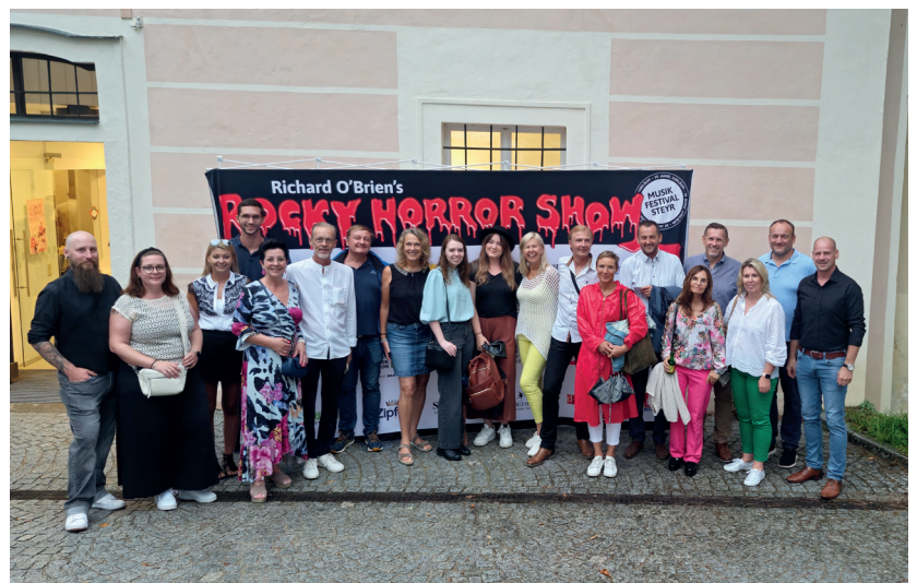
Foto: Stammtisch beim Musikfestival Steyr