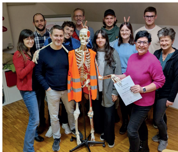
Foto: die Teilnehmer:innen beim firmenübergreifenden Erste-Hilfe-Auffrischkurs

Wenn Interesse besteht, aktiv in Arbeitsgruppen mitzuwirken, freuen wir uns über Kontaktaufnahme an office@steyrland.at .